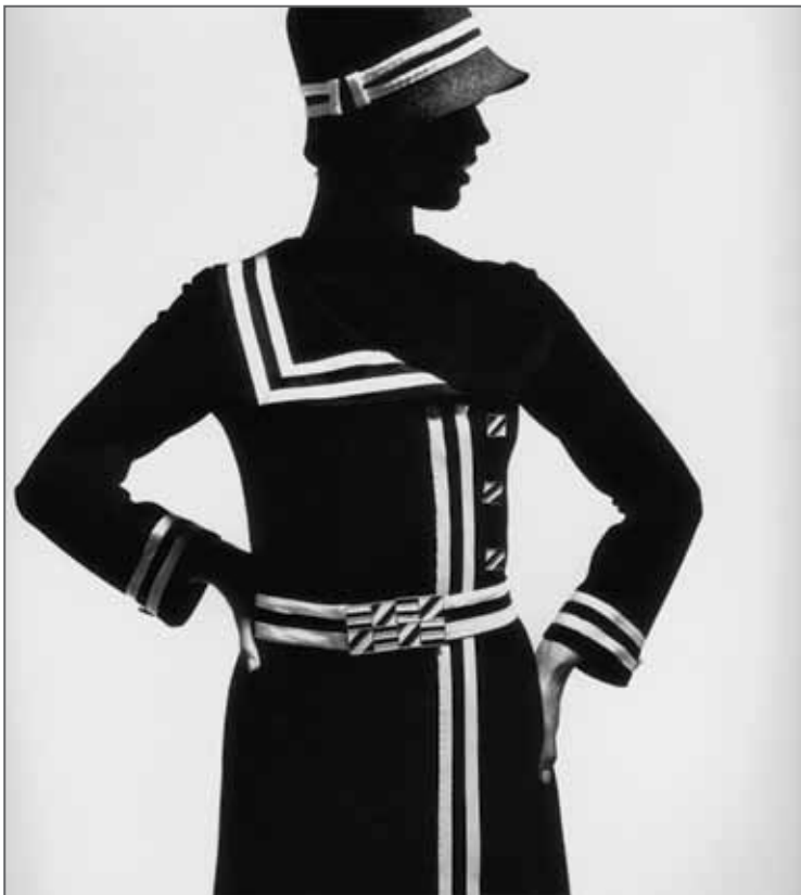
Mode Op-Art Manteau par Lend Paris 1966

F.C. Gundlach a été photographe de mode pour des magazines et des revues pendant trente ans. Cette période a non seulement vécu d'énormes changements sociaux, mais aussi connu diverses influences exercées par la scène internationale de la photographie et de l'édition, les beaux-arts et la mode elle-même. Cela se ressent dans le style pictural de Gundlach et dans ses compositions. Au début des années 1950, les scènes formelles dans des intérieurs élégants véhiculaient le rêve d'un luxe accessible; à la fin des années 1950, la mode photographiée à l'étranger reflétait le désir ardent de lieux lointains.