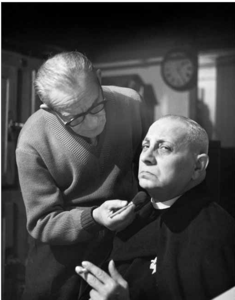
Erich von Stroheim pendant le tournage de « Alraune » Munich 1952