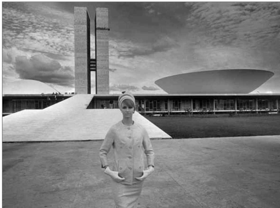
Tribunal Fédéral Suprême Brasília 1963

FCG - Les deux. Tout d'abord, j'avais un contrat avec Lufthansa, ce qui m'a permis de voyager beaucoup plus facilement. Je pouvais avoir des billets pour moi et mon équipe. Diverses maisons de mode ont manifesté un intérêt particulier pour certains pays à un moment donné. J'ai acheté un appartement à New York dans les années 1970. C'était l'endroit où il fallait être, c'était important pour moi. À la fin des années 70 et au début des années 80, j'ai beaucoup voyagé au Brésil, j'ai acheté une maison à Rio. Dans les années 60, j'ai commencé à voyager en Grèce et j'ai eu un lieu à Athènes, aux Canaries aussi. C'était une chance inouïe de passer d'un endroit à un autre. Parfois, je ne savais pas le matin que je passerais ma soirée à New York. Je prenais un travail, je prenais un avion.