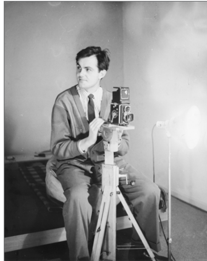
Autoportrait - 1956