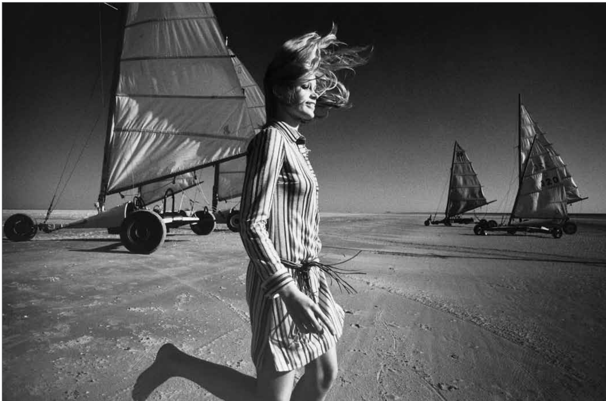
Mode Falke St. Peter Ording, Allemagne 1971