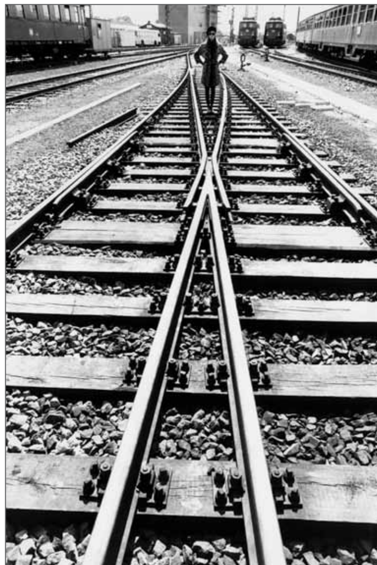
Ocelot sur les rails Hambourg 1970

A cette époque, Gundlach collaborait avec Elegante Welt . Il faisait des reportages dans des maisons au style affirmé, comme la collection Dior de 1951. Dans le numéro 9 de 1952, le rédacteur en chef F.W. Koebner a publié le premier reportage de mode de Gundlach avec une actrice: sa « promenade de mode avec Nadja » pour la compagnie Heinzelmann, alors en vogue, et qui a servi de test pour la série « Film Stars in Fashion » qui sera publié par la suite. A Paris, il a rencontré le rédacteur en chef Curt Waldenburger qui l'a définitivement conquis à la photographie de mode en lui proposant de le diffuser dans Film und Frau . A cette époque, Gundlach disposait déjà d'un book conséquent dont les photographies de mode étaient très variées. Il était le plus jeune photographe de l'équipe Film und Frau .