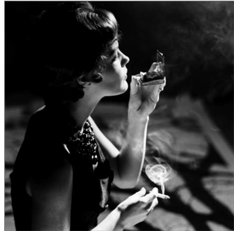
Romy Schneider Hambourg 1961