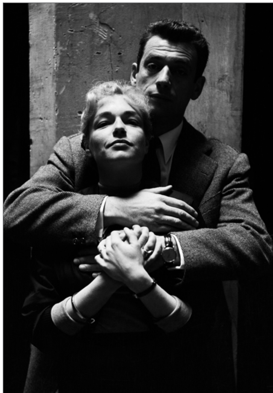
Simone Signoret et Yves Montand Paris 1953