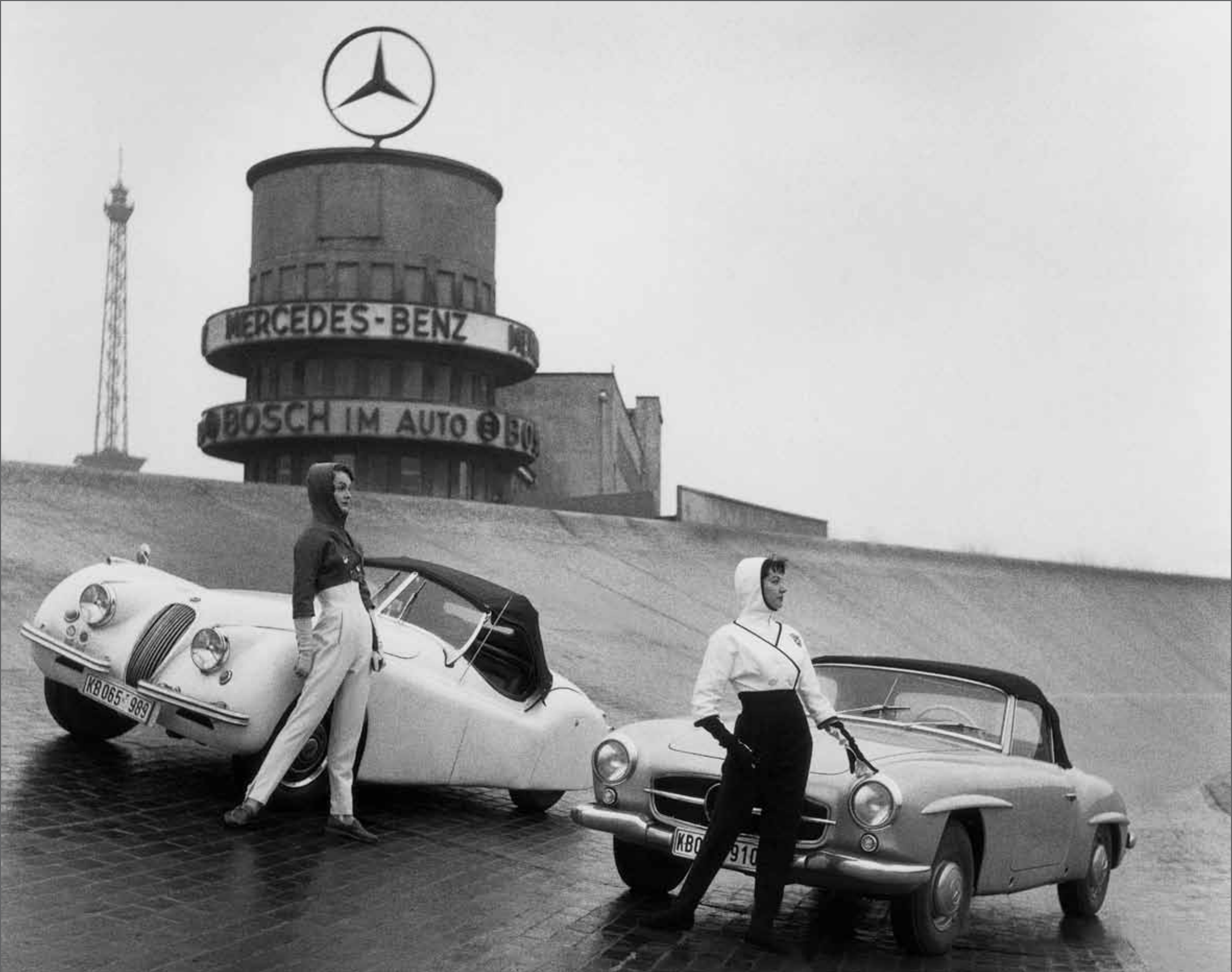
Après-ski à l'Avus Püppi et Schlippi Tailleurs-pantalon par Staebe-Seger. Berlin 1956